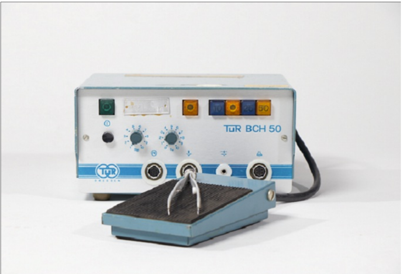
Hochfrequenz Chirurgiegerät Tur BCH 50

Das Projekt „Zusammenschau medizinischer Gerätesammlungen“ begann im Sommersemester 2020 und widmete sich der Erfassung und Aufbereitung der medizintechnischen Sammlung. Diese befanden sich zuvor unbeachtet in Kellerräumlichkeit des Universitätsklinikums. Die interdisziplinäre Projektgruppe mit den Studiengängen B.A. Cultural Engineering (FHW) und B.Sc. Medizintechnik (FEIT) setzte sich mit diesen Zeugen der Zeit genauer auseinander.